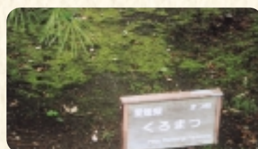
愛媛県の「くるまつ」