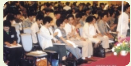
愛媛県の座席が一番前でした。