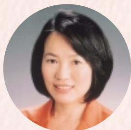
衆議院議員 あべ 俊子

新年あけましておめでとうございます。昨年は皆様のお力添えのおかげまで再び国政の場へ送り出して頂くことができました。あらためて愛媛県看護連盟の皆様のご支援の大きさをかみしめ、心より感謝いたしますとともに、本年もどうぞよろしくお願い申し上げます。