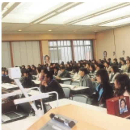
ミニレクチャー臨床