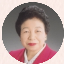
参議院議員 南野 知恵子