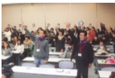
ジャンケン アッチむいてホイ