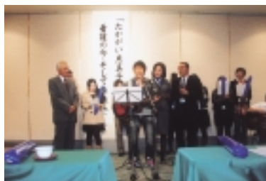
バンド演奏 バルーンで歓迎