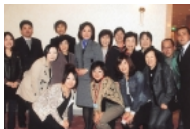
参加者といっしょに