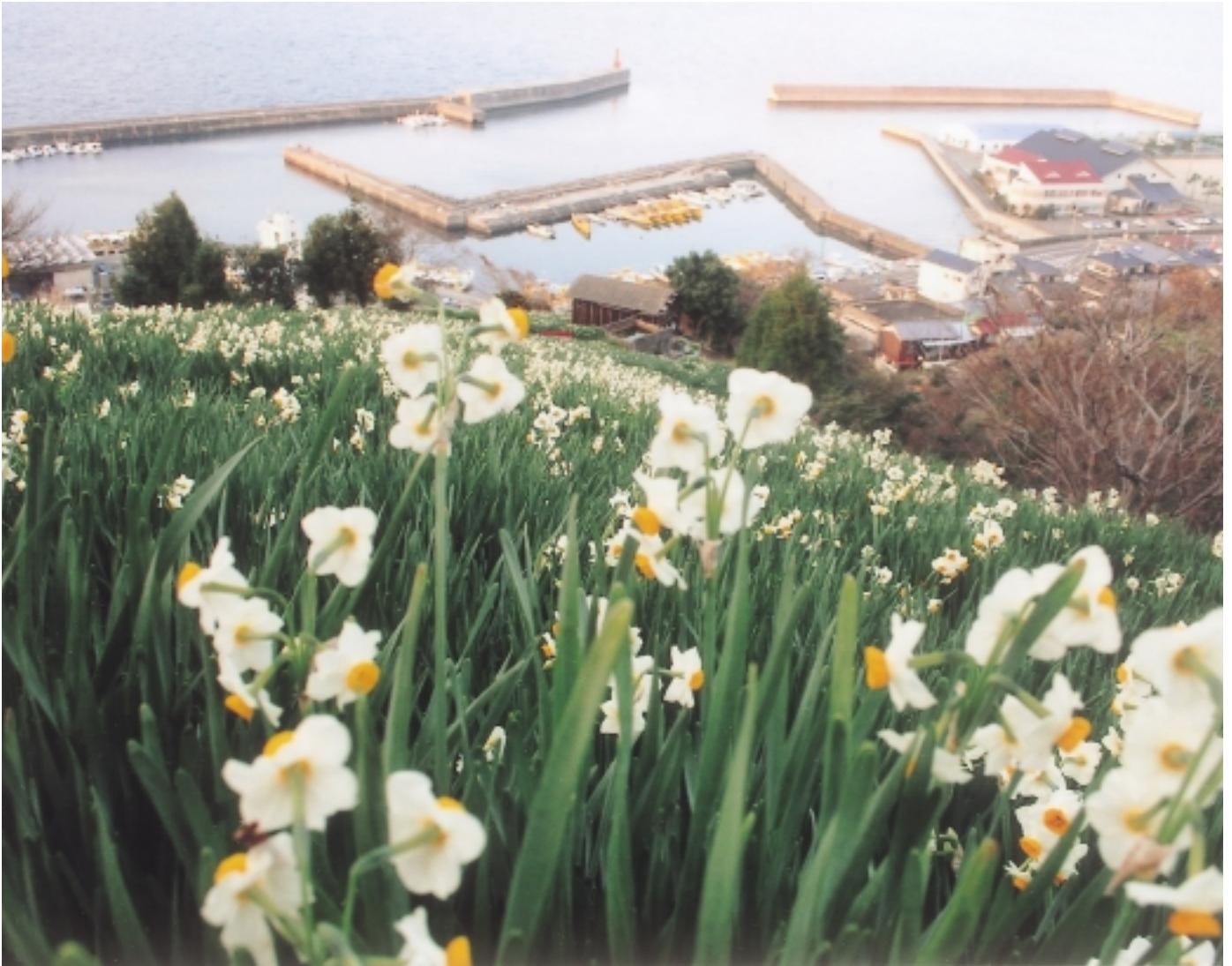
双海の雪中花 あまい香りのスイセン10万本