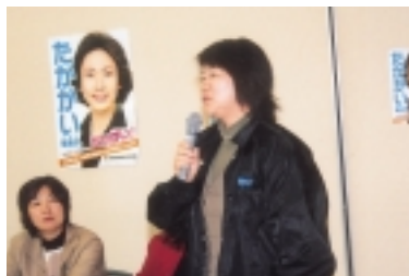
ミニレクチャー 訪問看護